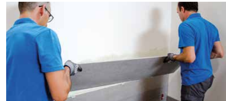
Affix the tile to the pre-prepared surface | Coloca la pieza sobre la superficie preparada | Placer la pièce sur la surface préparée | Verlegen Sie die Fliese auf der vorbereiteten Oberfläche

Une fois le mortier étendu, placer les pièces en veillant à laisser entre elles un jointolement minimal d'au moins 2 mm. Cette distance entre les pièces peut être maintenue à l'aide des croisillons de séparation.