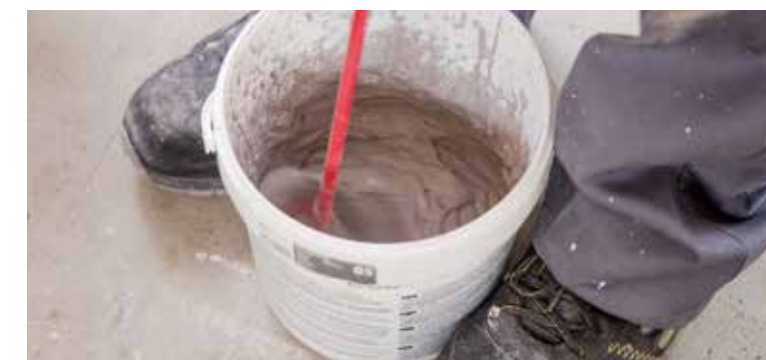
Prepare the grout | Preparar el material de rejuntado | Préparer le matériau de jointoiment | Rühren Sie das Fugenmaterial an

La préparation de la pâte de jointoiment suit un processus similaire à celui du ciment colle. Ainsi, mélanger le produit et l'eau selon les proportions indiquées par le fabricant pour ensuite étendre le matériau de jointoiment entre la séparation qu'il y a entre les pièces et la fixer à l'aide d'une spatule pour joints. Il est nécessaire de prendre en compte les temps recommandés par le fabricant.