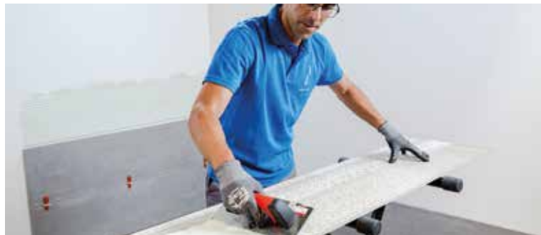
Spread the adhesive cement with a toothed trowel on the tile | Extiende el cemento de agarre con una llana dentada sobre la pieza | Étendre le ciment à prise rapide à l'aide d'une spatule dentée sur la pièce | Verstreichen Sie den Klebemörtel mit einem Zahnpachtel auf der Fliese

Vergewissern Sie sich, dass die Zementkleberschicht stets gleichmäßig dick ist. Um dies zu gewährleisten, behelfen wir uns mit einem Zahnpachtel mit einer Zahngröße von 10 mm und verteilen den Kleber lotrecht zur Längsseite der Fliese, damit die eventuell darunter verbleibende Luft entweichen kann.