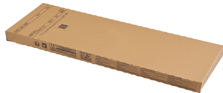
Check the product | Verifica el producto | Vérifier le produit | Überprüfen Sie das Produkt