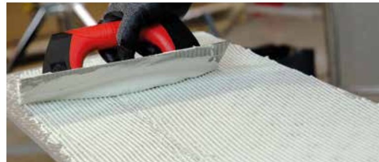
Make sure the thickness of the layer of adhesive cement is uniform | Asegúrate de que el grosor de la capa de cola sea uniforme | Veiller à ce que l'épaisseur de la couche de colle soit uniforme | Vergewissern Sie sich, dass die Kleberschicht gleichmäßig ist