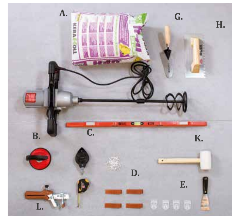
Prepare your materials | Prepara los materiales | Préparer les matériaux | Bereiten Sie die Materialien vor