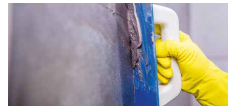
Use a grout trowel to affix the material | Utiliza una llana de rejuntado para fijar el material | Utiliser une spatule pour joints pour fixer le matériau | Verwenden Sie eine Fugenkelle zum Andrücken des Materials

Die Fugenmasse wird ähnlich wie der Zementkleber zubereitet. Produkt und Wasser in dem vom Hersteller angegebenen Verhältnis mischen. Anschließend das Fugenmaterial in die Zwischenräume zwischen den Fliesen füllen und mit einer Fugenkelle andrücken. Die vom Hersteller empfohlenen Zeiten müssen berücksichtigt werden.