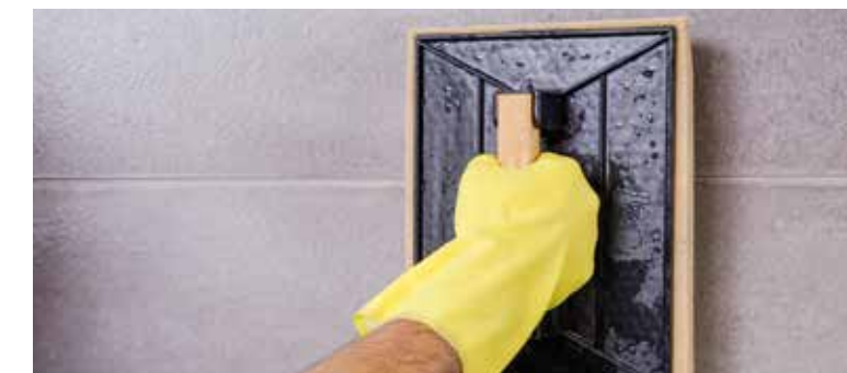
Remove any leftover grout and other dirt | Elimina los residuos de junta y demás suciedad | Éliminer les résidus de jointoiment et autres saletés | Entfernen Sie Fugenmaterialreste und andere Verunreinigungen