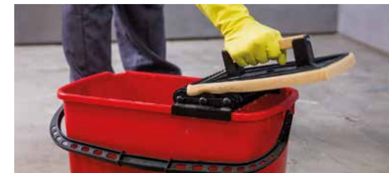
Choose a specific cleaning product | Selecciona un limpiador específico | Sélectionner un nettoyant spécifique | Wählen Sie einen speziellen Reiniger

Nach dem Verfugen muss überschüssiges Material entfernt werden, bevor es aushärtet. Wir empfehlen die Verwendung eines leicht saurehaltigen Reinigungsmittels, das keine giftigen Dämpfe entwickelt und Fugen, Material und Anwender schont, wie zum Beispiel Fila Deterdek. Im Fall von Fugen aus Epoxidharz empfiehlt sich die Verwendung eines speziellen Reinigers für Epoxy-Rückstände, zum Beispiel Fila CR10.