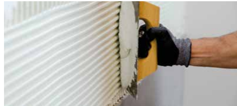
Make sure the thickness of the layer of adhesive cement is uniform | Asegúrate de que el grosor de la capa de cola sea uniforme | Veiller à ce que l'épaisseur de la couche de ciment colle soit uniforme | Vergewissern Sie sich, dass die Kleberschicht gleichmäßig ist