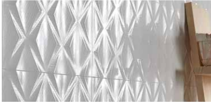
Observe the drying time | Respete el tiempo de secado | Respecter le temps de séchage | Halten Sie die Trockenzeit ein

Although each manufacturer gives a specific drying time for adhesive cement, in general terms it should be left to dry for at least 24 hours, after which you can start the grouting process.