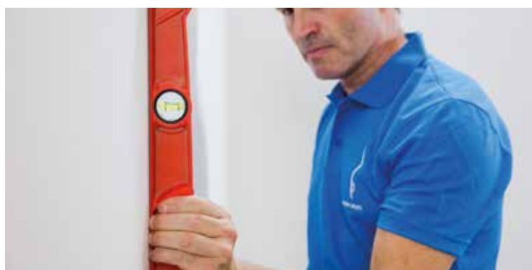
Check the level | Comprueba la nivelación | Vérifier le nivellement | Überprüfen Sie die Nivellierung

Mit diesem Material wird ein solider, glatter und gleichmäßiger Untergrund erzielt, der mit den vor der Verlegung der keramischen Bodenfliesen aufgetragenen Klebern kompatibel ist. Je nach Einsatz (drinnen oder draußen) sind verschiedene Arten von Ausgleichsmassen erhältlich. Ebenso hängt die Dicke der Schicht von der Beanspruchung und der ausgleichenden Unebenheit ab (3 bis 15 mm pro Schicht bei geringer Beanspruchung, 10 bis 40 mm bei gewerblicher Nutzung und 20 bis 40 mm für intensive industrielle Beanspruchung).