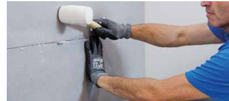
Use the flexible rubber mallet | Utiliza una maza de goma flexible | Utiliser un maillet en caoutchouc souple | Verwenden Sie einen biegsamen Gummihammer

Nach dem Auftragen des Mörtels kann damit begonnen werden, die Fliesen zu verlegen. Dabei berücksichtigen, dass zwischen den Fliesen eine Fuge von mindestens 2 mm vorgesehen werden muss. Dieser Abstand zwischen den Fliesen kann mit Hilfe von Kreuzlaschen sichergestellt werden.