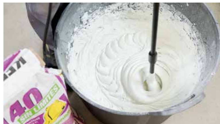
Adhesive cement | Cemento de agarre | Ciment à prise rapide | Klebemörtel

Je nach dem Keramiktyp, der geklebt werden soll (weißer Scherben, Feinsteinzeug etc.), dem Verlegungsort (drinnen oder draußen) und den Klimabedingungen, denen das Produkt ausgesetzt werden soll (feuchte Gebiete, Hitze, Frost etc.), gibt es unterschiedliche Arten von Zementkleber. Sowohl Kleber als auch Fugenmaterial sind Teil des Belags und müssen für die vorgesehene Verwendung und den Keramiktyp geeignet sein.