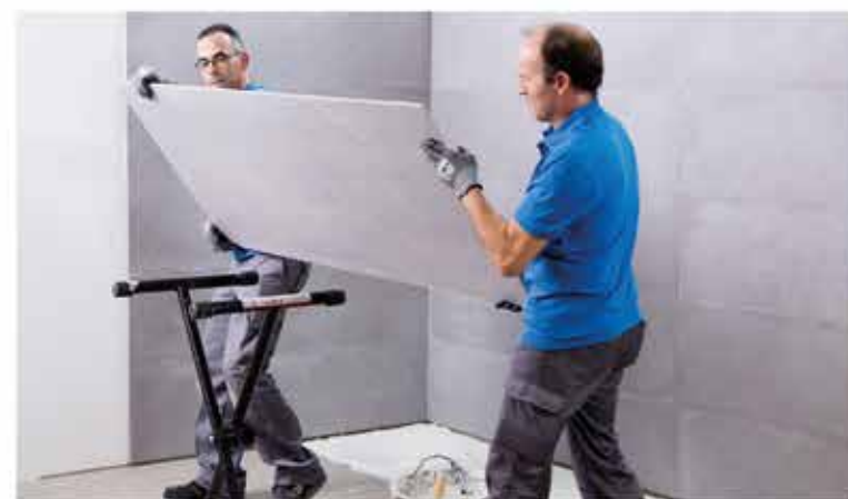
Handle the tiles correctly | Manipula correctamente las piezas | Manipuler correctement les pièces | Behandeln Sie die Fliesen korrekt

Depending on the size of the tile, they may have to be handled by two people. To make this easier, you can use suction tile lifters to give you a better grip.