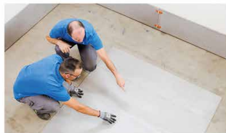
Choose the layout of the tiles | Selecciona la disposición de las piezas | Sélectionner la disposition des pièces | Wählen Sie die Anordnung der Fliesen

All our tile collections have individual designs. We recommend that you lay them out flat before starting to install them to make sure that the different designs match up with their neighbouring tiles. The results can be amazing!