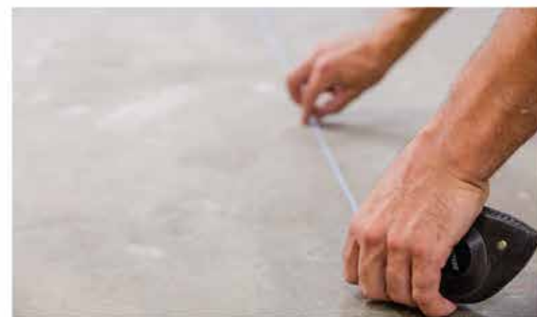
Set the guideline | Plantea la línea maestra | Établir la ligne maestrale | Spannen Sie die Richtschnur.

The guideline should be parallel to the floor line. This will help you to lay the first tiles and means you will be able to make the most productive use of the tiles you have available.