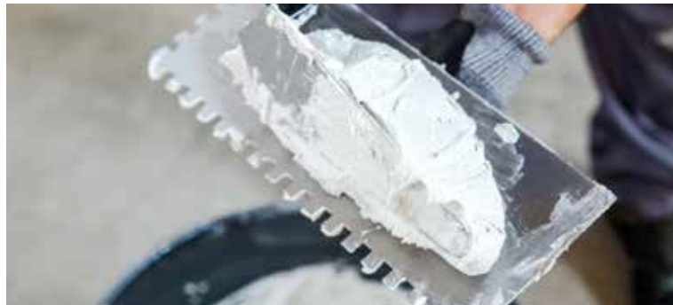
Spread the adhesive cement with a toothed trowel | Extiende el cemento de agarre con una llana dentada | Étendre le ciment à prise rapide à l'aide d'une spatule dentée | Verstreichen Sie den Klebemörtel mit einem Zahnpachtel

Den Klebemörtel mit einem Zahnpachtel an der gespannten Richtschnur entlang auf der bereits ausgehärteten und nivellierten Oberfläche verstreichen.