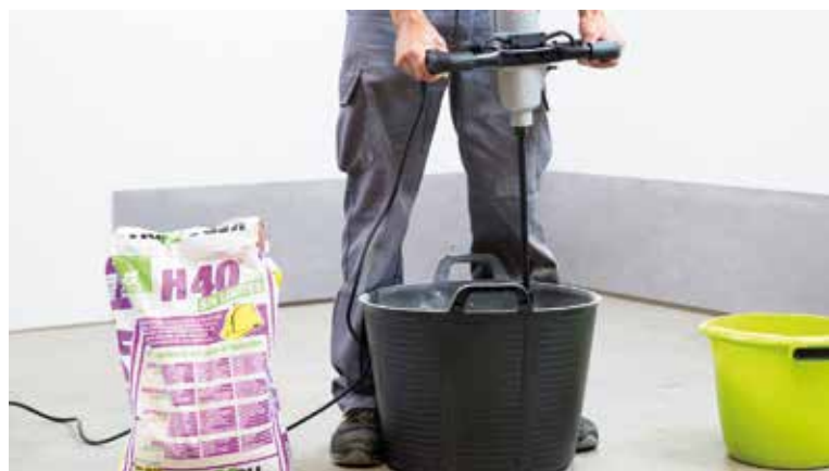
Prepare the adhesive cement | Prepara el cemento de agarre | Préparer le ciment à prise rapide Bereiten Sie den Klebemörtel vor

Il existe sur le marché plusieurs variétés de ciment colle en fonction du type de céramique que l'on souhaite coller (pâte blanche, grès porcelainé, etc.), du lieu de l'installation (intérieur ou extérieur) ainsi que de la climatologie à laquelle sera exposé le produit (zones humides, chaleur, gel, etc.). L'adhésif et le jointoiement font partie du recouvrement et il convient d'appliquer ceux qui sont adéquats pour leur emploi et la typologie du produit céramique.