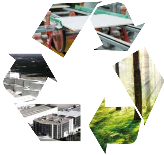
Follow the rules of waste management | Sigue la normativa de gestión de residuos | Suivez les règles de gestion des déchets | Folgen Sie den Regeln der Abfallwirtschaft

All our packaging and products are recyclable, so we recommend you dispose of them at the appropriate selective collection points. Please deal with them according to the waste management regulations applicable in your country, specifically those for packaging waste and ceramic claddings.